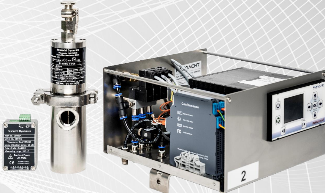
(Fig. Viscosimetro a vibrazione con unità di controllo PentaSmart installata e cablata in scatola di montaggio in acciaio inox).

Controllo automatico della viscosità e della temperatura basato sul principio di misurazione delle vibrazioni